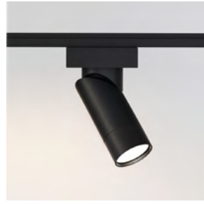
BOB GU10 spot